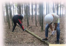
✿ かぐや姫の 遊歩道整備