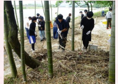
かぐや姫の遊歩道整備